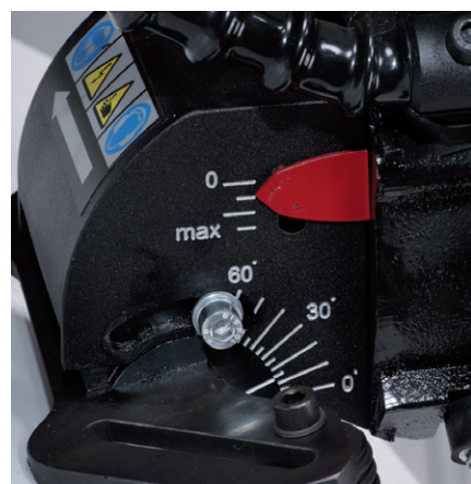
Kontinuirano podešavanje ugla od 0-60°