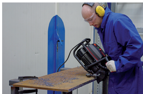
Horizontalno poravnavanje ploča